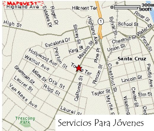
Servicios Para Jóvenes 709 Mission Street Santa Cruz, California